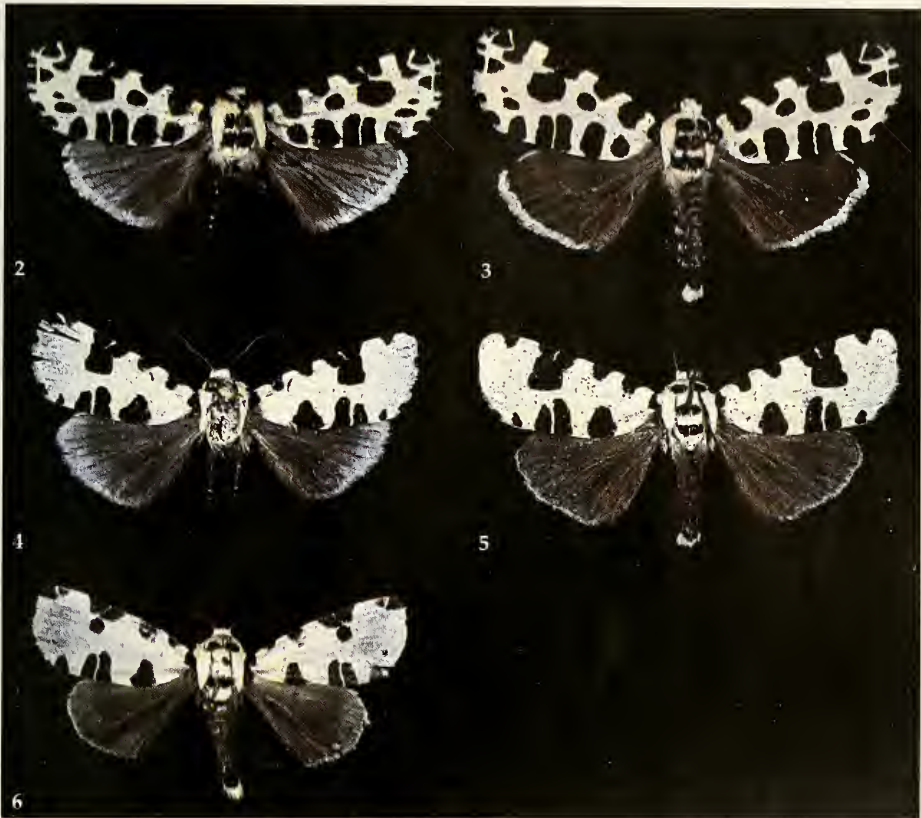
Abb. 2-6. Clethrorasa species. 2. Clethrorasa kossnerae , spec. nov. ♂ Holotypus. 3. C. kossnerae , spec. nov. ♀ Paratypus. 4. C. pilcheri Hampson, ♂. 5. C. pilcheri Hampson, ♀. 6. C. micropuncta Holloway, ♀.